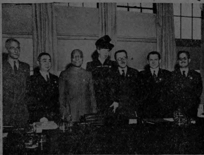
El Comité de Derechos Humanos de las Naciones Unidas inaugura sus sesiones bajo la presidencia de la Sra. Eleanor Roosevelt.

• NUEVA YORK.—La delegación norteamericana al Organismo de Naciones Unidas presentó recientemente un proyecto de resolución en el sentido de que esta entidad adopte las disposiciones que sean necesarias para el mantenimiento de la libertad de información internacional.